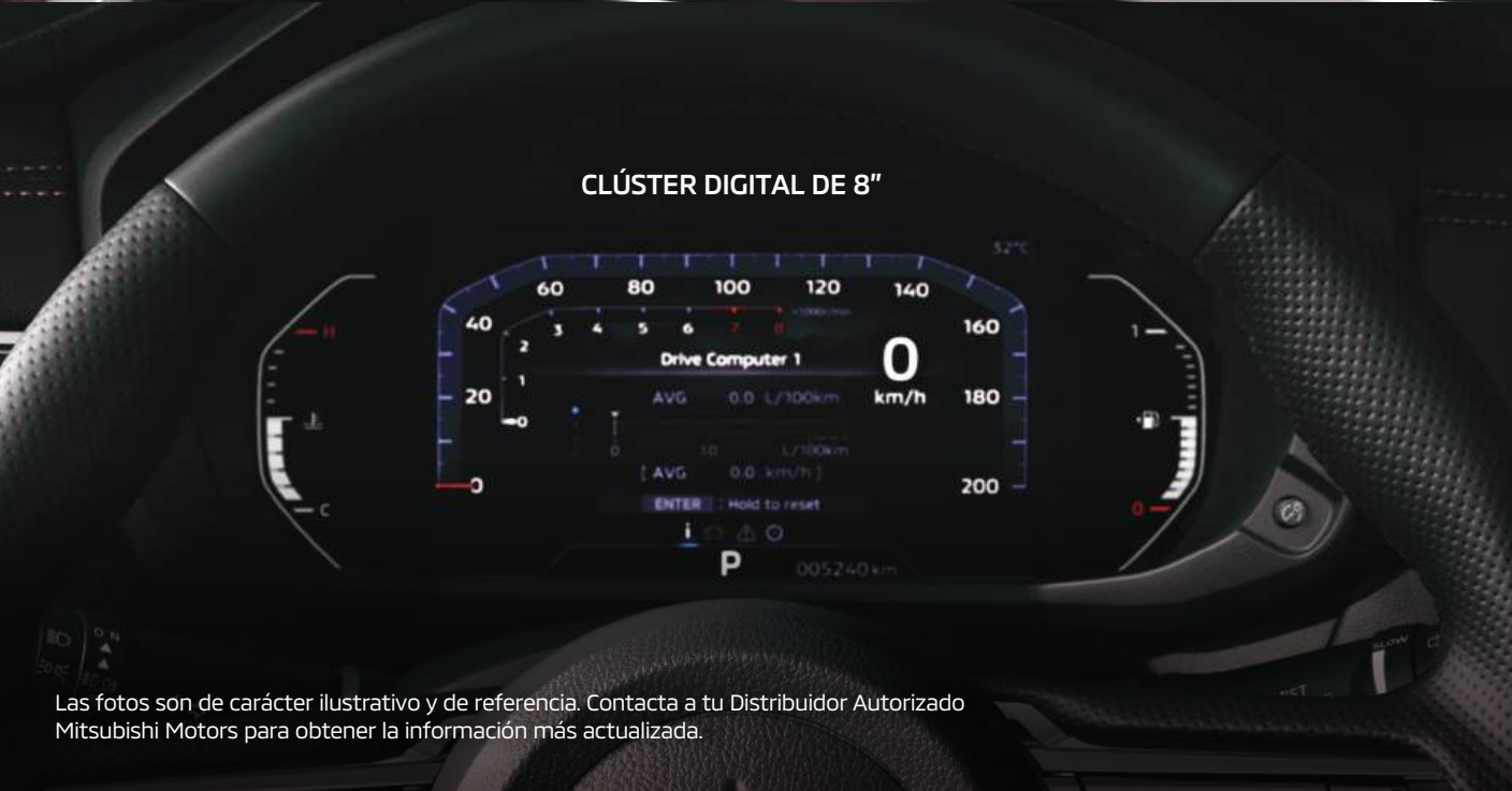
CLÚSTER DIGITAL DE 8"