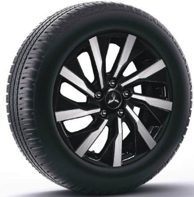
RINES DE ALUMINIO 17" BITONO XPANDER CROSS