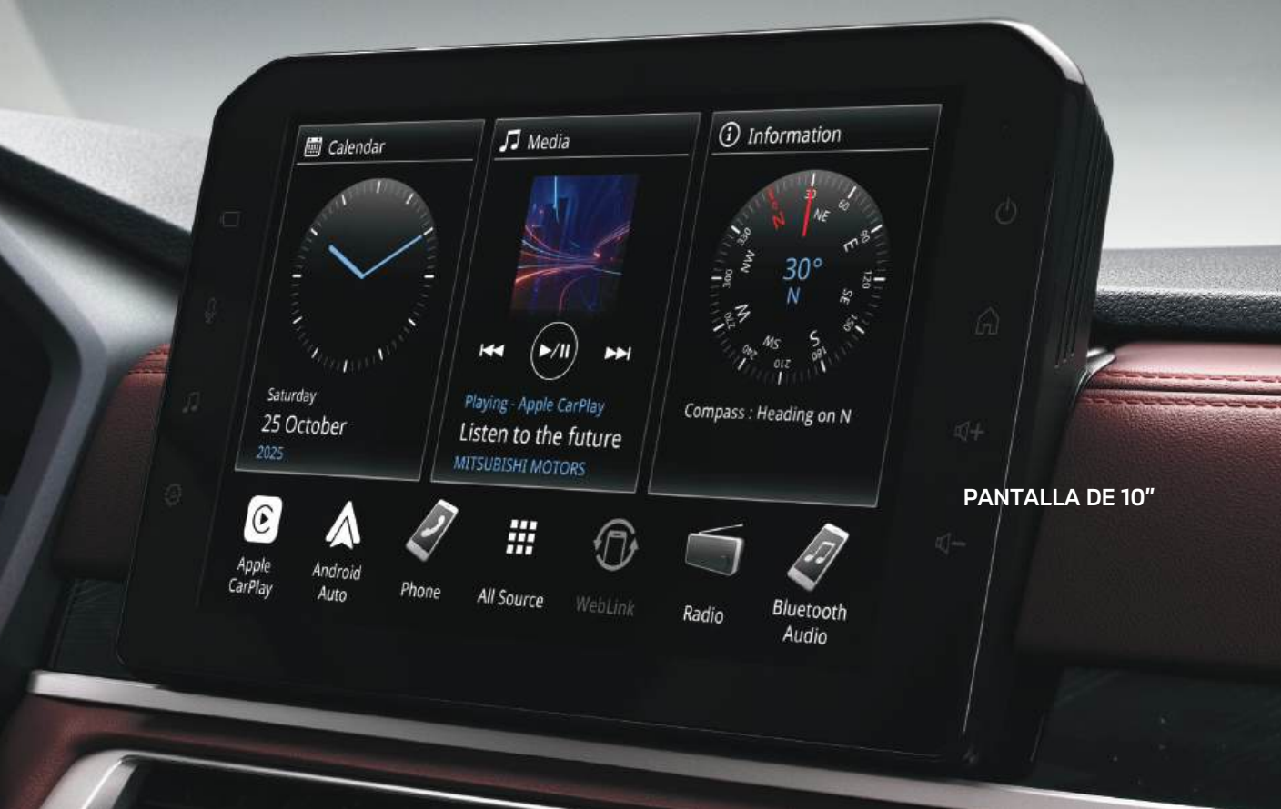
PANTALLA DE 10"