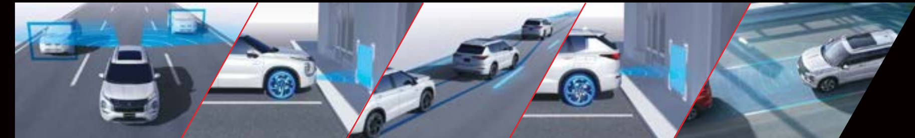
MONITOR DE PUNTO CIEGO CON ALERTA DE TRÁFICO CRUZADO TRASERO