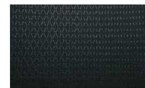
Tela negra - versiones GLX

Toda la información contenida en este material está basada en datos disponibles al momento de su publicación. Las descripciones son correctas, Mitsubishi Motors de México, S.A. de C.V. se esfuerza por mantener la precisión, sin embargo, la exactitud no puede garantizarse. De vez en cuando, Mitsubishi Motors de México, S.A. de C.V. necesita actualizar o modificar las características e información del vehículo ya mostradas en esta ficha técnica. Algunos vehículos presentados incluyen equipamientos opcionales que pueden no estar disponibles en algunas regiones. Todas las fotos y las pantallas son de carácter ilustrativo y de referencia. Mitsubishi Motors de México, S.A. de C.V. por medio de la publicación y distribución de este material no crea garantía, expresa o implícita, en relación a cualquiera de los productos de Mitsubishi Motors. Contacta a tu Distribuidor más cercano para obtener la información más actualizada. Garantía Defensa a Defensa: 7 años sin kilometraje limitado. Consulta términos y condiciones en www.mitsubishi-motors.mx . Este vehículo contiene los dispositivos de seguridad obligatorios de conformidad con la NOM-194-SE-2021.