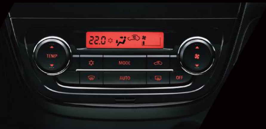
AIRE ACONDICIONADO AUTOMÁTICO

Olvida la rutina, con el nuevo MIRAGE G4 tus viajes siempre serán distintos. Conecta tu teléfono, sube el volumen de tu canción favorita y disfruta el viaje. Vas a necesitar una playlist muy larga.