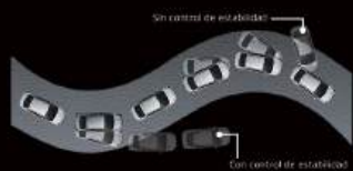
CONTROL DE ESTABILIDAD