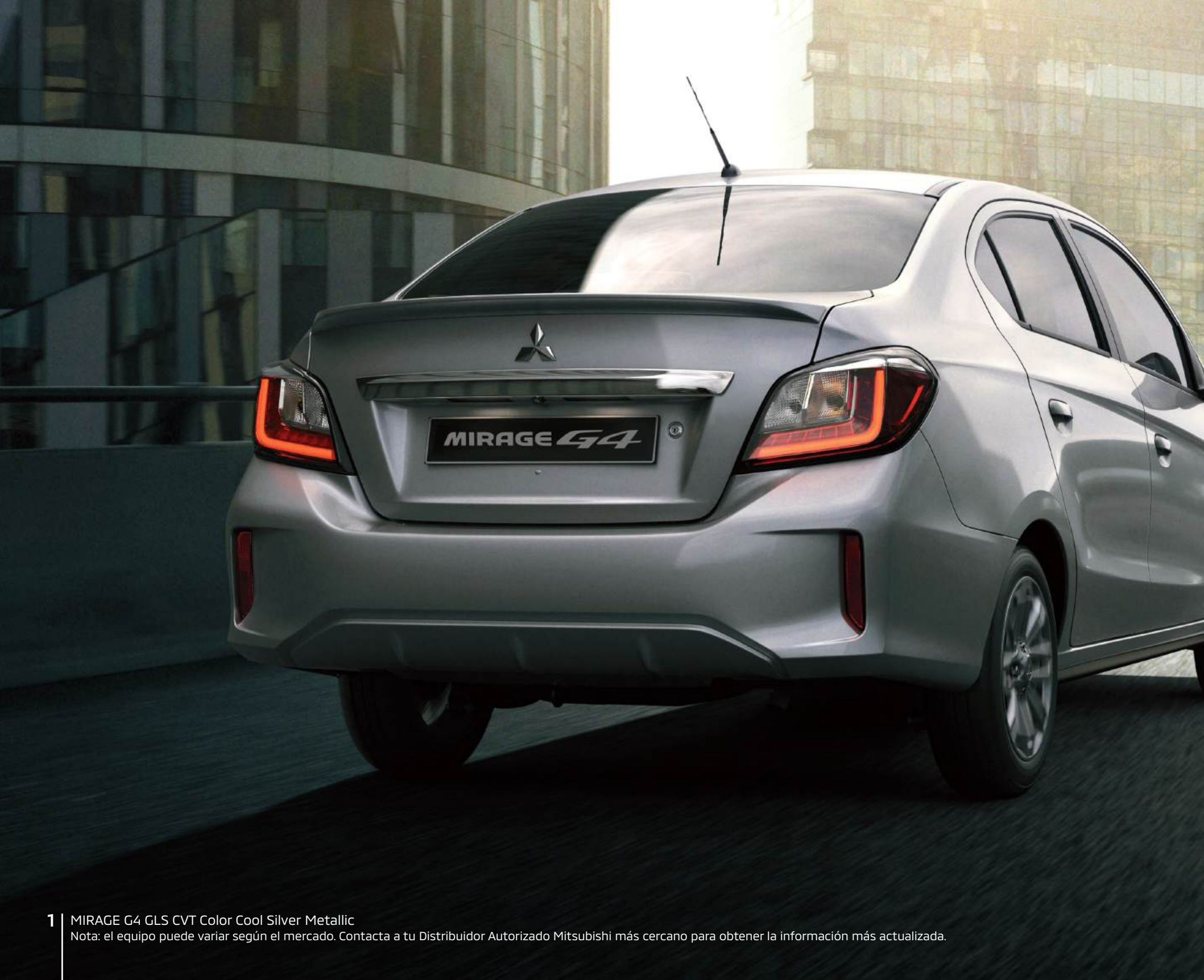
1 | MIRAGE G4 GLS CVT Color Cool Silver Metallic Nota: el equipo puede variar según el mercado. Contacta a tu Distribuidor Autorizado Mitsubishi más cercano para obtener la información más actualizada.