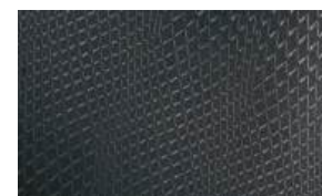
Tela bitono gris - versiones GLS