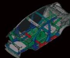
CHASIS REFORZADO (RISE)