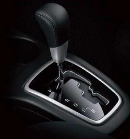
PALANCA DE VELOCIDADES FORRADA EN PIEL