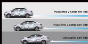
FRENOS ABS Y DISTRIBUCIÓN ELECTRÓNICA DE FRENADO