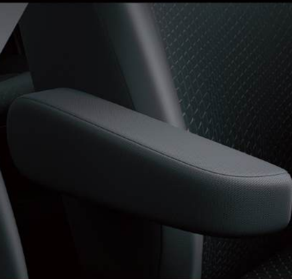
ASIENTO DEL CONDUCTOR CON DESCANSABRAZOS