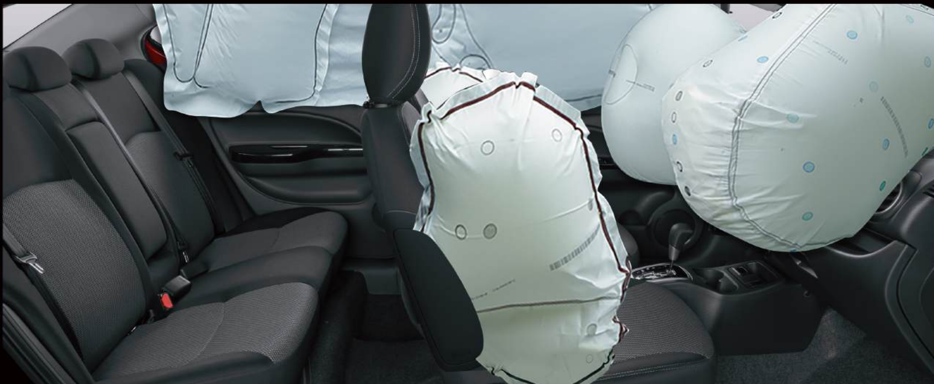
6 BOLSAS DE AIRE

Equipamiento de seguridad para que viajes tranquilo y recorras más kilómetros.