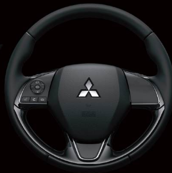
CONTROLES AL VOLANTE