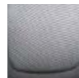
Black Xpander GLS