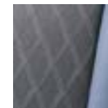
Black and Navy Xpander Cross

Toda la información contenida en este material está basada en datos disponibles al momento de su publicación. Las descripciones son correctas, Mitsubishi Motors de México, S.A. de C.V. se esfuerza por mantener la precisión, sin embargo, la exactitud no puede garantizarse. De vez en cuando, Mitsubishi Motors de México, S.A. de C.V. necesita actualizar o modificar las características e información del vehículo ya mostradas en esta ficha técnica. Algunos vehículos presentados incluyen equipamientos opcionales que pueden no estar disponibles en algunas regiones. Todas las fotos y las pantallas son de carácter ilustrativo y de referencia. Mitsubishi Motors de México, S.A. de C.V. por medio de la publicación y distribución de este material no crea garantía, expresa o implícita, en relación a cualquiera de los productos de Mitsubishi Motors. Contacta a tu Distribuidor más cercano para obtener la información más actualizada. Garantía Defensa a Defensa: 7 años sin kilometraje limitado. Consulta términos y condiciones en www.mitsubishi-motors.mx . Este vehículo contiene los dispositivos de seguridad obligatorios de conformidad con la NOM-194-SE-2021.