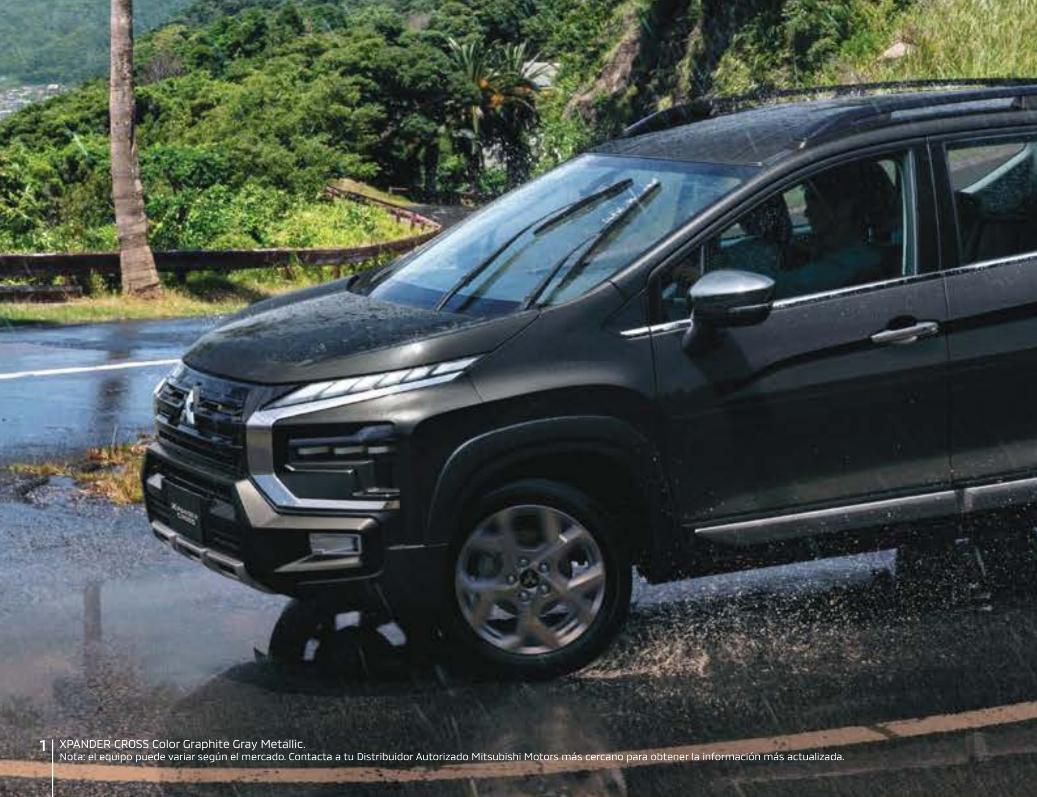
1 | XPANDER CROSS Color Graphite Gray Metallic. Nota: el equipo puede variar según el mercado. Contacta a tu Distribuidor Autorizado Mitsubishi Motors más cercano para obtener la información más actualizada.