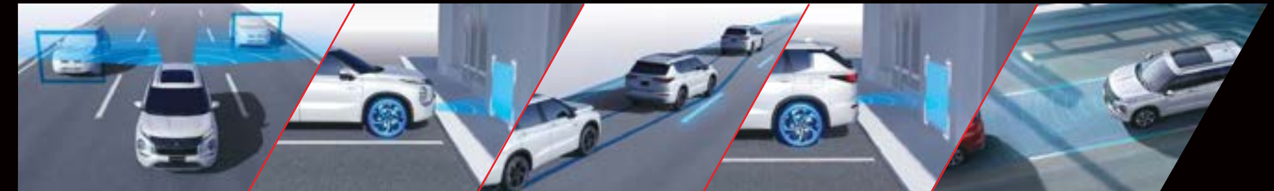
MONITOR DE PUNTO CIEGO CON ALERTA DE TRÁFICO CRUZADO TRASERO