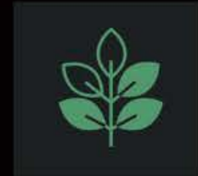
Diagrama digital de energía eléctrica y combustible en el tablero para conocer tu rendimiento.