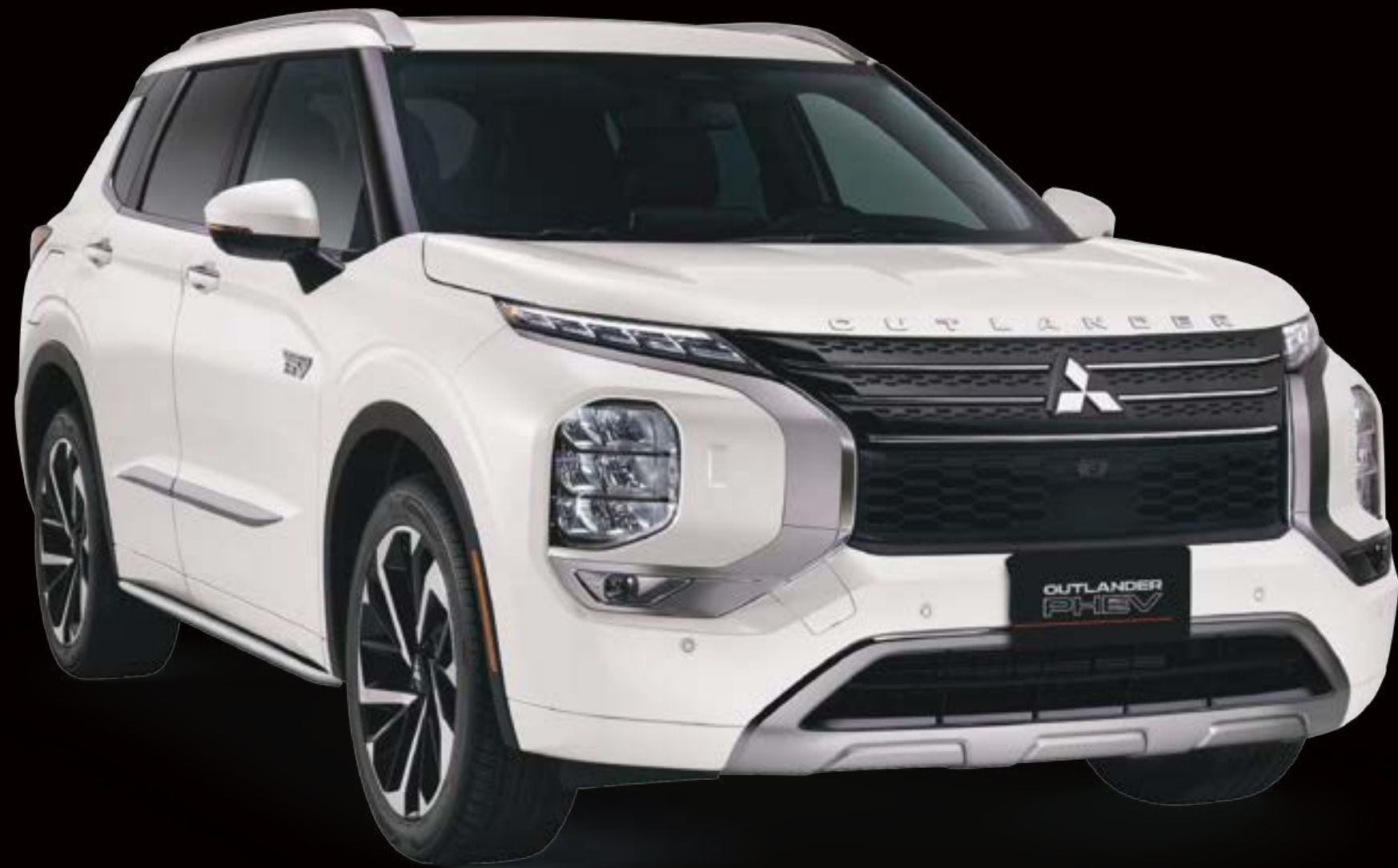
Protección cromo puerta trasera

Encuentra la solución que necesitas para que luzca acorde contigo.